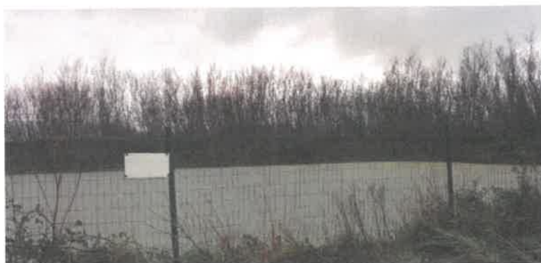
Bassin de 1500 m 3 Photos prises par le CE le 4 janvier 2021