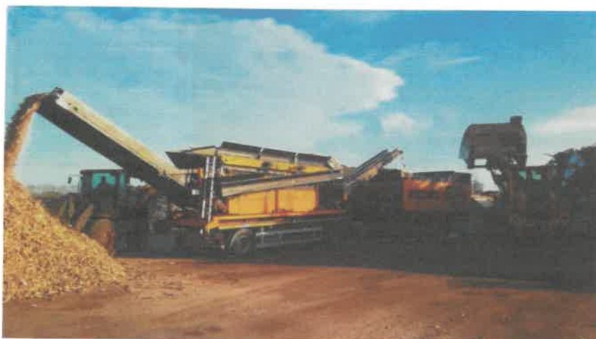
Unité de broyage.

L'unité de broyage mobile comporte un déchiqueteur, une trémie, un convoyeur. Ces équipements sont placés sur une structure de support. Ce matériel est présent sur le site uniquement lors des campagnes de broyage.