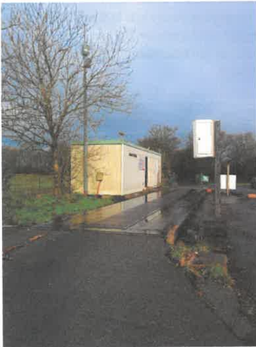
Pont bascule et bungalow

Je photographie le pont-bascule situé devant le bungalow. Je découvre les bassins et réseaux et le grillage autour du site, qui comporte une petite ouverture sans doute pratiquée par des sangliers. Une benne d'une contenance de 30 m 3 est présente sur le site.