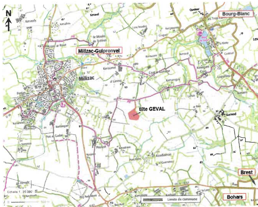
Situation du site.

DAE : Projet d'extension d'activité de la plate-forme de tri, de transit, de regroupement et de broyage de déchets de bois au lieu-dit « Coat Ar Gueveur » à Milizac-Guipronvel par la société GEVAL